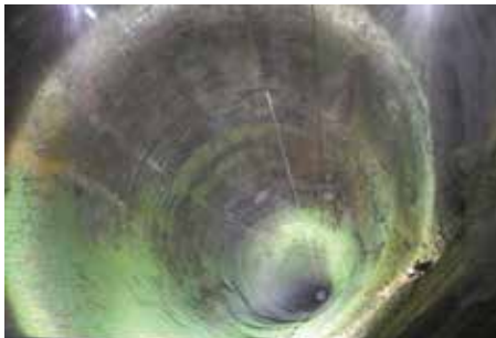
Festung Königstein, der Brunnen