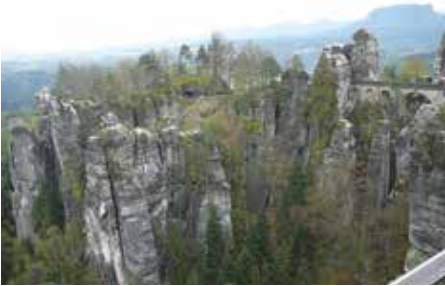
Bastei, Foto: Hellmut K.

Von dort folgt nach dem Essen noch der mühsame Gang zum „Lilienstein“ gegenüber von Königstein. Auch hier werden wir nach kurzem, aber heftigem Anstieg (Stufen, Leitern) mit herrlichen Aussichten belohnt. Nach einem – wiederum stufenreichen Abstieg – geht es nun mit der Fäh-