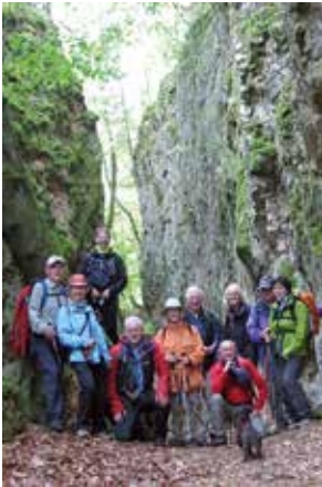
Schriesheim 2017