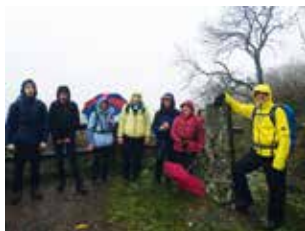
Lemberg 2017