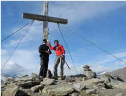
auf dem Gipfel des Wilden Mannle

Seelein die erste Trinkpause ein. Hierbei bemerke ich, dass ich meine AV-Trinkflasche wohl auf der Vernagthütte vergessen habe. Nach langem Hin und Her entschließe ich mich zur Vernagthütte zurück zu laufen, um sie zu holen. Nach ca. 1 Stunde