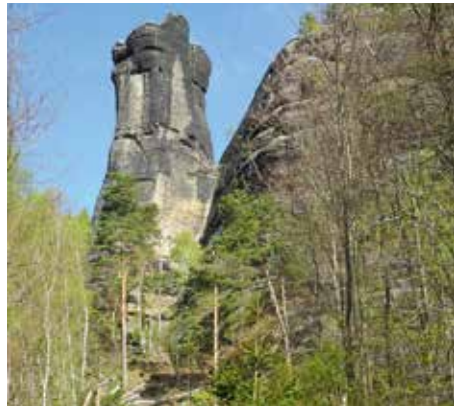
Schrammsteintorwände, Foto: Hubert St.

begehen sind und ein Abstieg darauf strikt verboten ist. Auf der „Schrammsteinaussicht“ angekommen wird uns ein unvergleichliches Panorama geboten. Vom „Pfaffenstein“ über das Elbtal mit der Festung Königstein reicht der Blick hinüber zum „Lilienstein“, dem „Falkenstein“, Kirnitzschtal und weiter zu den „Affensteinen“ und über den kleinen und großen „Winterberg“ bis weit in die böhmische Schweiz hinein. Nach einer ausgedehnten Mittagspause führt uns der Rückweg auf dem „Gratweg“ entlang in Richtung „Schrammsteine“, wo wir zahllose Leitern und Treppen im Auf- und Abstieg zu überwinden haben. Von dort geht es weiter auf dem „Schrammsteinweg“ und einen Teil des „Malerweges“ hinüber zur „Heiligen Stiege“. Diese steigen wir ab bis zum „Heringsgrund“ und über den „Wurzelweg“ erreichen wir wieder unsere Unterkunft. Heidrun hat ein Buch über sächsische