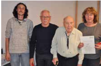
40 Jahre Mitgliedschaft