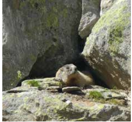
Es grüßt das Murmeltier