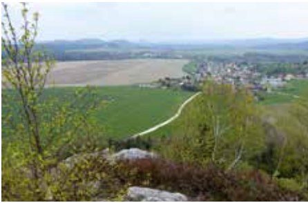
Rundblick in die Sächs. Schweiz, Foto: Walter Str.

Dem Papststein gegenüber liegt der Gohrisch (448 m). Er liegt südlich des Kurortes Gohrisch, der als ältester Ort für erholsame Sommerfrische in der Region gilt, in dem sich auch der russische Komponist Dmitri Schostakowitsch 1960 aufge-