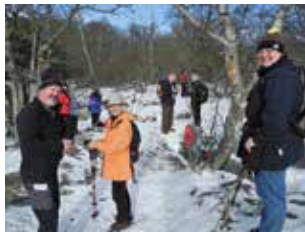
Drachenfelstour 2017