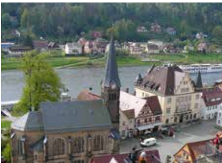
Aussicht auf Wehlen

Die Gruppe trotz der Verlockungen in der Auslage einer Bonbon-Manufaktur und macht sich erst mal warm mit einigen Stufen zu einem Aussichtspunkt im Ort. Es geht – von Felswänden und -pfeilern mit Überhängen umsäumt – im