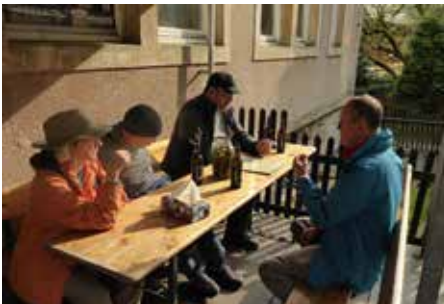
ein Kiloglas Gurken

sen allerdings in die Gegenrichtung an der Straße entlang, an der leider total verfallenen Haidemühle vorbei, als zum großen Entzücken von Hubert die gelbe Straßenbahn an uns vorbei fährt.