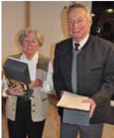
60 Jahre Mitgliedschaft

Rund 30 Mitglieder waren zur Mitgliederehrung 2017 erschienen, darunter Mitglieder, die 60 -, 40 - oder 25 Jahre Mitglied des DAV sind und Mitglieder, die im Jahr 2017 einen runden Geburtstag (ab 70) feiern konnten oder noch feiern. Bei Kaffee und Kuchen gab es zunächst einen Jahresrückblick mit Bildern, zusammen-