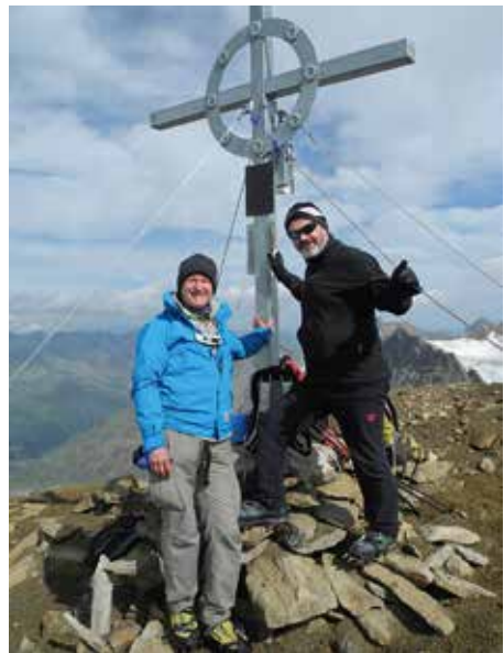
Gipfel des Fluchthorns

rück und steigen anfangs über steilen Firn und dann teilweise Blankeis auf. Die letzten Meter sind schnee- und eisfrei und um 10:20 Uhr wird der Gipfel des Fluchthorns auf 3497m Höhe erreicht. Die Wildspitze grüßt im Sonnenlicht auffordernd herüber. Nach dem Eintrag in das Gipfelbuch und ein paar Fotos, wobei wir den Weg über den Guslarferner talwärts in Richtung