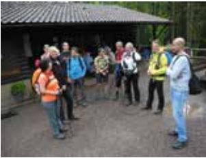
Wasgau 2017