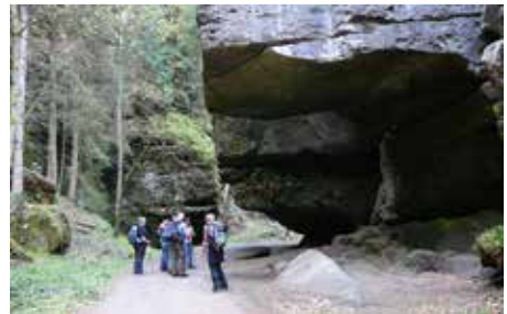
Zscherre Grund

Anschaulich erläutert eine Schautafel am Wegesrand die Theorie der Entstehung