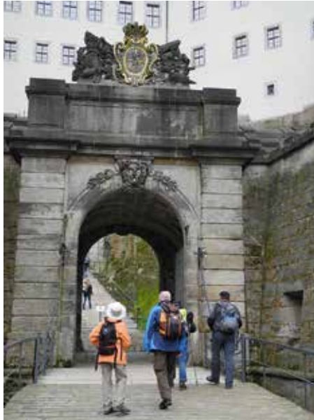
Festung Königstein, der Eingang

gerechnet, nehmen wir an einer geführten Tour durch die gesamte Festung teil. Sie ist sehr gut und informativ. Dann, nach