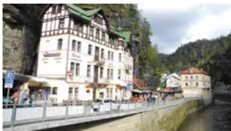
nach Tschechien