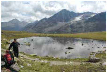
Trinkpause am Seelein

warten mussten um einigermaßen das Gelände sehen zu können. Nach dem Frühstück um 07:00 Uhr mit reichhaltigem Buffet machen wir uns gegen 09:30 Uhr auf den Weg in Richtung Breslauer Hütte. Zunächst geht es ca. 100 Höhenmeter bergab zu einem Steg, um den Vernagtbach zu queren. Hier sieht man auch auf die meteorologische Station. Von dort führt der Weg, der sogenannte Seuffertweg, leicht ansteigend durch herrliche Bergmatten.