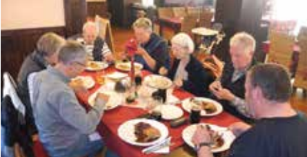
Essen in Hrensko

testens um 09:00 Uhr abmarschiert wird. Thomas als Einheimischer hatte sich bereit erklärt, für die Brötchen zum Frühstück zu sorgen. Heute steht die Schrammsteintour auf dem Programm. Pünktlich starten wir bei herrlichem Wetter in Richtung Zwieselhütte. Entlang dem Elbleitenweg