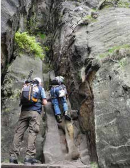
der Einstieg, Foto: Hubert St.

1898 Kurgäste, Wanderer und Touristen befördert. Auf etwa 8 Kilometern begleitet die meterspurige Überlandstraßenbahn das Flüsschen Kirnitzsch auf seinem Lauf durch die bizarre Felsenwelt des Elbsandsteingebirges von Bad Schandau zum Lichtenhainer Wasserfall. Wir müs-