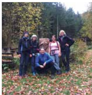
Eußerthal 2017