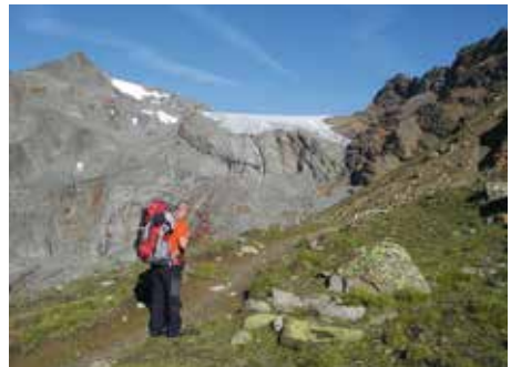
Aufstieg zum Kesselwandferner

Um 05:30 Uhr wird aufgestanden und um 06:30 Uhr sitzen wir beim Frühstück. Es gibt reichhaltiges Frühstücksbuffet. Vorher sind wir aber noch vor der Tür und saugen