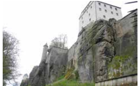
Festung Königstein