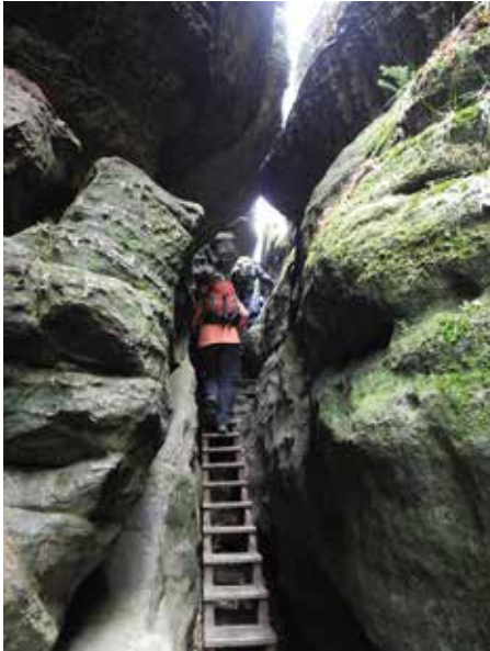
durch Schluchten, Foto: Hubert St.

Wie jeden Tag brechen wir auch heute um 9:00 Uhr auf. Der Himmel ist leider grau, anfangs nieselt es sogar und kalt ist es außerdem. Unsere Ziele sind heute die diversen „...-Steine“ auf der südlichen Seite der Elbe, eine Reihe von Tafelbergen, die wir mit dem Auto erreichen. Wir fangen am Pfaffenstein an. Er liegt wie ein Tafelberg in der Landschaft, bestehend zum großen Teil aus Sandsteinstehlen. Der Zuweg