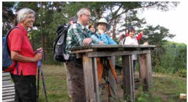
Lambrecht 2017, Foto: Ralf P.