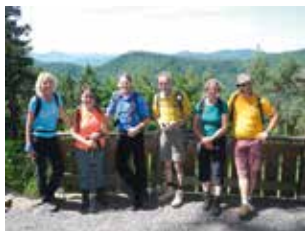
Kalmit 2017

Treffpunkt: 8:30 Uhr Kletterzentrum „Pfalz Rock“