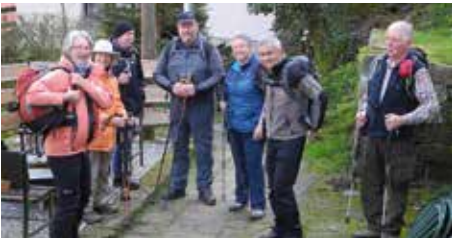
Abmarsch zu den Schrammsteinen

vermitteln uns hier die oberhalb liegenden Felsen schon einen ersten Eindruck, was wir heute noch zu erwarten haben. Oberhalb der „kleinen Bastei“ am „Rauschenstein“ und „Teufelsturm“ vorbei geht es in Richtung „Großes Schrammtor“. Dort legen wir die erste Pause ein. Schon vorher hat uns der „Schrammtorwächter“ mit seinen mächtigen Wänden beeindruckt. Zwischen hohen Felstürmen und teils glatt geschliffenen Wänden wandern wir zum „Wildschützensteig“, einem zünftig mit Geländern und Stahltreppen ausgestatteten Steig, über welchen wir uns in Richtung „Schrammsteinaussicht“ hinauf