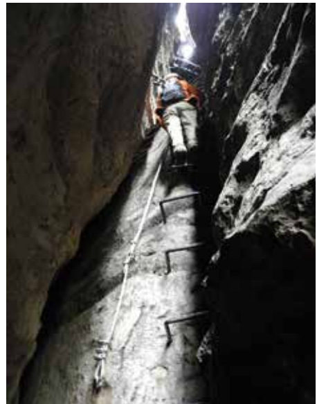
der Durchstieg