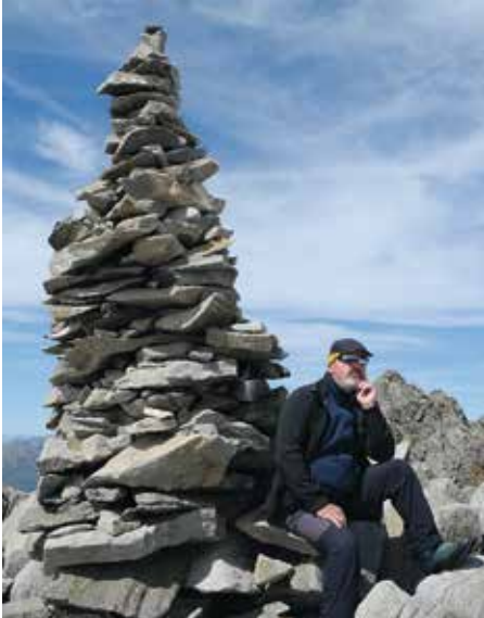
Stoanmandln auf der Dahmannspitze

Nach einer Gehzeit von ca. 1 Stunde legen wir eine halb-stündige Pause ein. Das grandiose Panorama entschädigt für das miese Wetter des Vortags und unsere Mo-