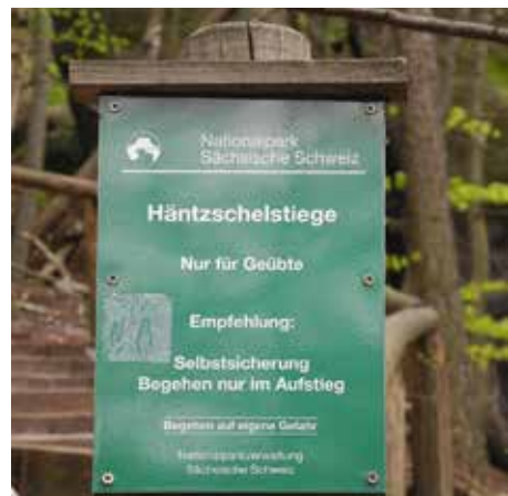
die Häntzschelstiege, Foto: Hubert St.

Felandschaft. Nachdem die Himmelsleiter erklommen ist, kehren wir im Restaurant am Lichtenhainer Wasserfall ein. Köstlich die Forelle dort! Hier war auch die Haltestelle der Kirnitzschtalbahn, die seit