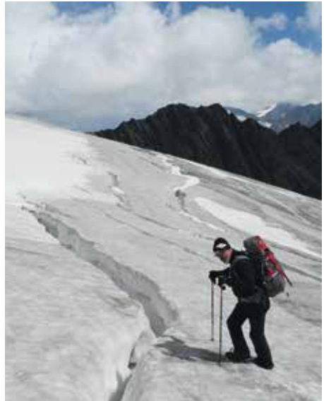
Wieder über den Gletscher

Höhenmeter über dem Eis, sodass einem hier der Gletscherschwund drastisch vor Augen geführt wird. Nach dem Ablegen der Steigeisen und dem Aufstieg über Blockfels erreichen wir das Brandenburger Haus auf 3277m um 12:20 Uhr. Hier genießen wir zunächst die Aussicht und das Panorama bei einem zischenden Radler. Als nächstes nehmen wir Kontakt zum Hüttenwirt auf, um die reservierten Lager zu bestimmen. Der Hüttenhelfer hat uns mit seinem deutlichen schwäbischen Akzent schon vorbereitet, dass das ganze Personal hier oben wohl schwäbischer Herkunft ist. Der Hüttenwirt Alfred ist ein überaus freundlicher Vollbart und quartiert uns im 4er-Zimmer seines Helfers ein. Da der Hausberg, die Dahmannspitze mit