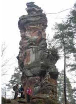
Napoleonfels 2017

Die Touren sind zwischen 10 und 14 km, maximal 400 Höhenmeter. Treffpunkt ist in der Regel um 9:00 Uhr am Kletterzentrum Pfalz Rock.