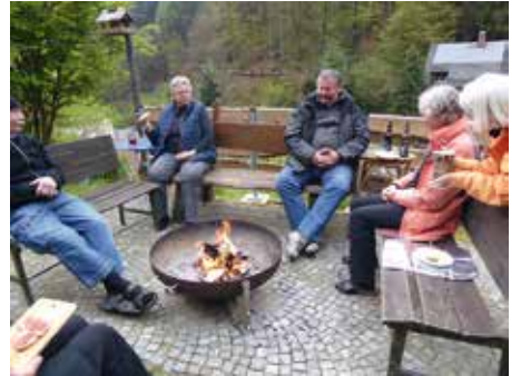
Ausklang am Feuer

Königstein, der Bastei, Lilienstein, der Affen- und Schrammsteine, die wir alle bereits erwandert haben.