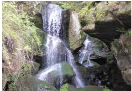
Lichtenhainer Wasserfall

Heute geht es wieder bis zur Baustelle im Wald, rechts den Lehnsteig hoch bis zum Reitsteig, die Affensteinpromenade entlang bis zum Pavillon, dann erfolgt der Abstieg zur alten Zeughausstrasse und der Anstieg zum Kuhstall, eine eindrucksvolle