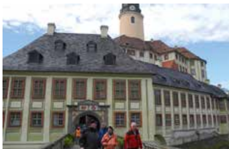
Schloss Weesenstein, Foto: Hubert St.

Ein paar Minuten vor 08:00 Uhr trifft sich die Gruppe an der Kletterhalle bei herrlichem Sonnenschein. Kurz danach kommt Walter mit seinem Bus angebraust und wir laden unser Gepäck ein, das bis über die hinteren Kopfstützen reicht. Anschließend geht es los über die A6 in Richtung Frankfurt. Weiter auf der A4 trübt