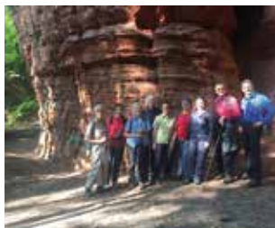
Altschlossfelsen 2017

Wanderweg: Helmbachweiher – Kurzes Eck – Erlenkopf Forsthaus Taubensuhl – Helm-bachtal – Windlöcher – Hornesselwiese – Iggelbachtal – Forsthaus Frechtal – Helmbachweiher