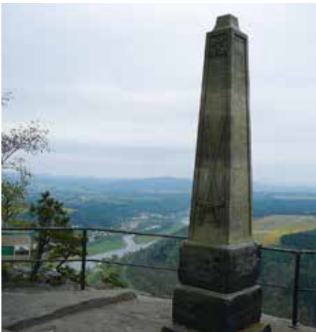
auf dem Lilienstein

re über die Elbe nach Königstein und mit Zug und Fähre nach Schmilka. 16 km und 500 Höhenmeter „Genusswanderung“ – ein herrlicher Tag im Nationalpark Sächsische Schweiz. Hellmut Kerutt