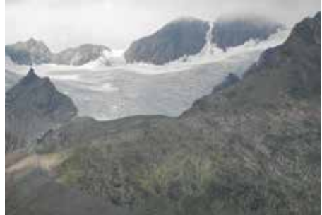
Abstieg von der Vernagthütte

Wildspitze von hier aus ca. 2 Stunden mehr Zeit in Anspruch nimmt als von der Breslauer Hütte, wäre die Zeit zu knapp bemessen, zumal wir bis nach 09:00 Uhr