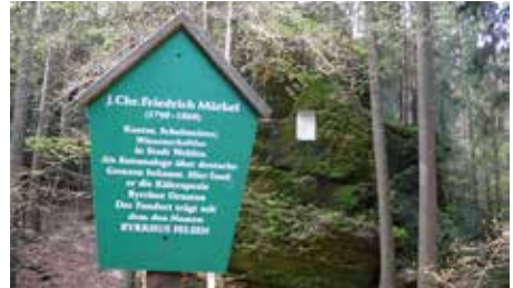
Burrhus, Foto: Hellmut K.

„Wehler Grund“ leicht bergan bis zum „Märkel-Denkmal“. Es ist gewidmet dem Entdecker der Käferspezies Burrhus ornatus , ein Fels im Hintergrund der Tafel ist benannt als Burrhus-Felsen.