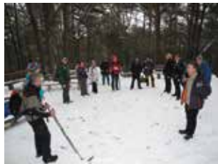
Dichter Hain 2017