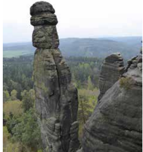
Barbarine, Foto: Walter St.

Am Barbarinen-Aussichtspunkt erfahren wir einiges zur Geschichte der schmalen 43 m hohen Felsnadel, die Barbarine,