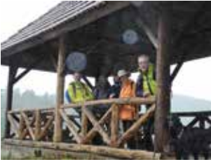
Elmstein 2017

Treffpunkt: 8:30 Uhr Kletterzentrum „Pfalz Rock“ Anfahrt: Mit dem PKW zum Naturfreundehaus Heidenbrunnertal über Lambrecht Wanderweg: NFH Heidenbrunnertal – Kleine Ebene – Platte – Hellerhütte – Jakobshütte – Kropfsberg – Ruine Spangenberg – Erfenstein – Iptestal – Kapuzinerberg – Langes Eck – Kaisergarten – NFH Heidenbrunnertal Wanderzeit: ca. 6,0 – 6,5 Std., ca. 21,8 km, ca. 757 hm Verpflegung: Rucksack, ev. Einkehr in Erfenstein Führung: Hubert Stadler, Tel. 06233/54586 Mobil 0176 72352775